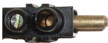
Partie male attenante au générateur